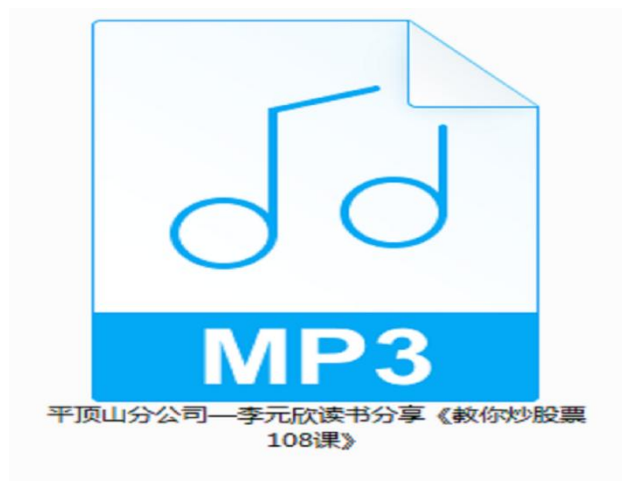
《教你炒股票 108 课》读书分享音频图