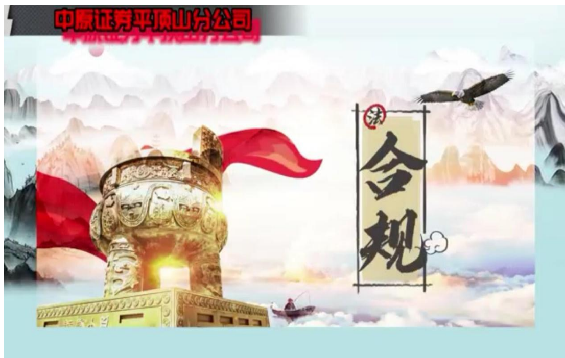
《合规人人有责、合规创造价值》视频图

为贯彻落实中国证监会关于证券行业文化建设部署、党委会决议精神和公司文化建设管理办法，促进公司合规文化建设，合规管理总部联合战略发展部举办了以“合规人人有责、合规创造价值”为主题的合规文化宣传素材制作评比活动，本人制作的“合规人人有责、合规创造价值(视频)”获得奖项。