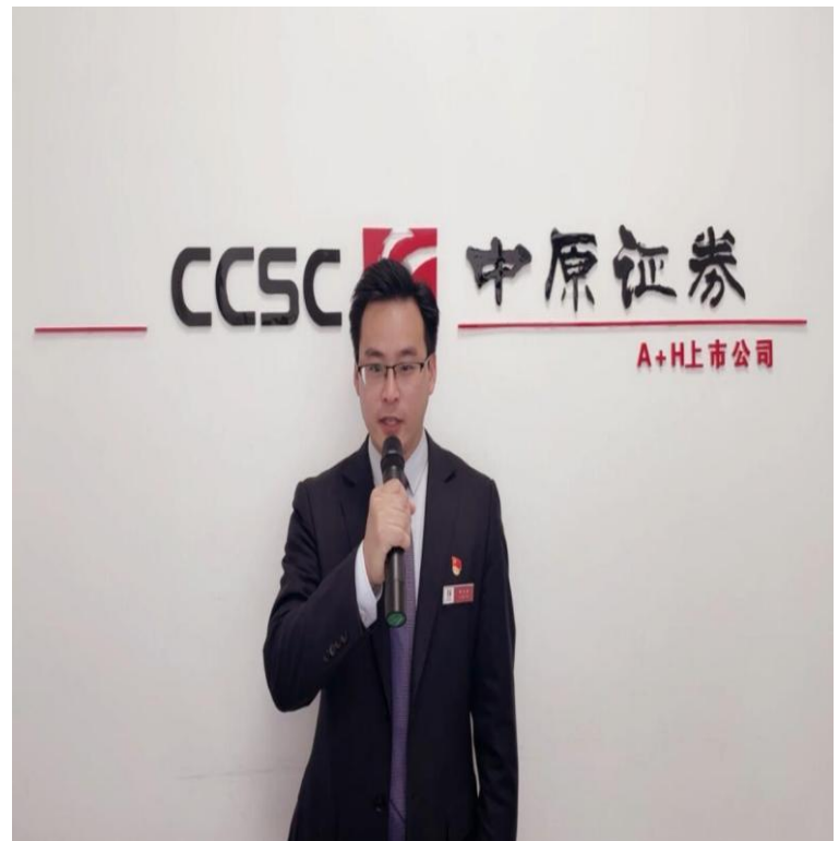
党的创新理论宣讲图

“因为经典，所以分享；因为受益良多，所以愿意去推广传播”。本人于2021年积极参加公司举办读书分享活动，熟读经典股市网络作品《教你炒股票108课》，吸取精华，去其糟粕，形成文案，制作成音频文件，供广大投资者和同事们一起学习、进步。