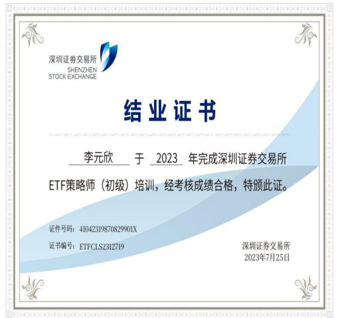
参加深交所 ETF 策略师培训图片

在过去的一年中，我完成视频见证 10699 次，视频见证工作既要保量又要保质，正当区域第一名，充分的保障了区域内视频见证工作的顺利进行，零积压，零失误。