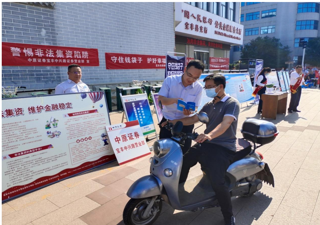
参与防范非法集资公益活动现场图片