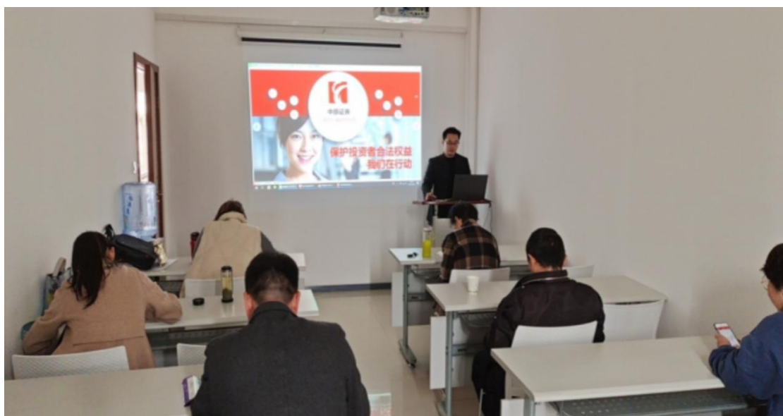
《保护投资者的合法权益——我们在行动》公益活动现场图片

积极投入到投资者的保护工作中去，与投资者面对面的交流，践行《保护投资者的合法权益——我们在行动》。