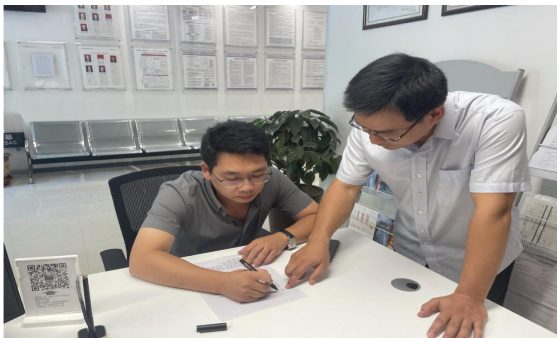
柜台业务现场指导客户填表图片

在工作中，我积极履行职责，做好柜台本质工作，做到零失误、全合规。认真对待每一位顾客，为顾客提供贴心优质的服务。