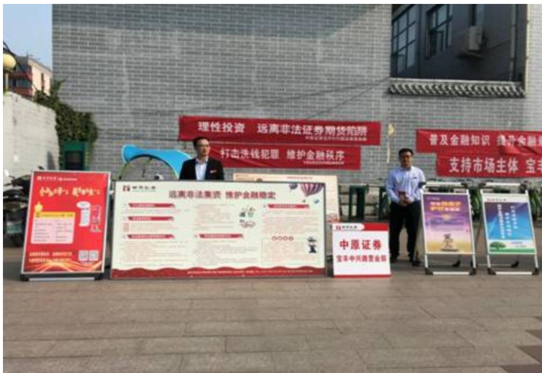
参与反洗钱公益活动现场图片