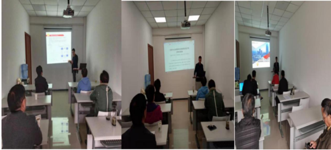
周六投资学院证券基础知识传播公益活动现场照片

举办并担任本营业部周六线下投资学院证券基础知识传播公益活动主讲人近数十场，得到了广大投资者的赞誉和信任。