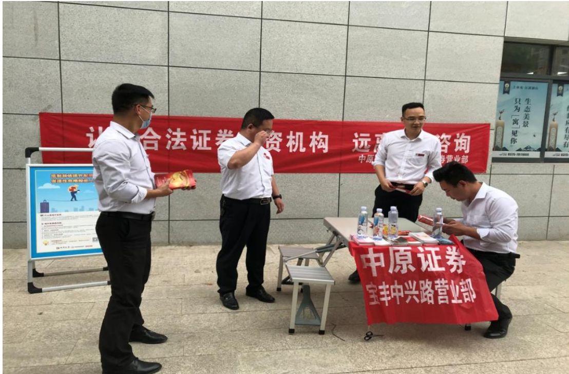
参与防范非法证券公益活动现场图片

积极深入到社区，践行防范非法证券、非法集资、反洗钱等活动，切实做好保护投资者合法权益等投教工作。