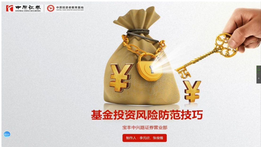
《基金投资风险防范技巧》视频截图

本人积极参加河南证监局组织的行业文化建设及投资者教育工作，并制作了《基金投资风险防范技巧》视频文件，入选中原证券投资者教育基地，供广大投资者学习，受到一致好评。